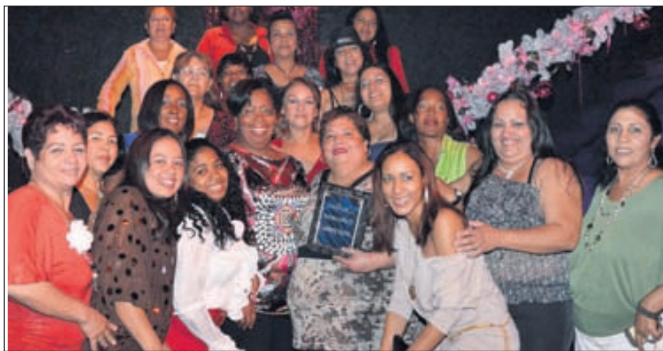
Housekeeping ricibiendo Departament of the Year.